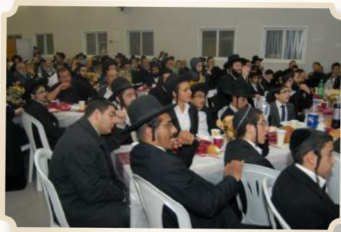
בחורי הישיבה וציבור המשתתפים מאזינים בקשב רב למשא הקודש

השלישית, ובתלת הוי חזקה, ואנו משתדלים לעשות את כל המאמצים יחד עם ראש הישיבה שממש עושה כאן מסירות נפש אדירה להחזיק את הישיבה! עושה כאן מאמצים, ורואים את הזכויות שלו, רואים את המסירות נפש שלו. "לראות את האולם הזה מלא התרגשתי!" אנשים צריכים לשלם כאן כדי להכנס, איזה מסירות נפש זו, איזה סייעתא דשמיא יש כאן בהחזקת הישיבה הזו, רואים את זה על כל צעד ושעל, את המאמץ בהחזקה של הישיבה ובחינוך של הישיבה, לא מעניין