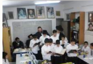
התלמידים המסיימים אומרים הדרן עלך