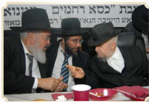
מרן שליט"א משוחח עם ראש המועצה והרב גדסי