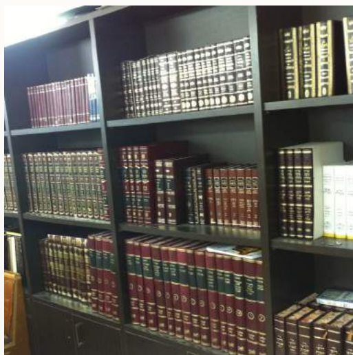
אוצר הספרים בישיבה שהולך ונבנה

התלמידים קוראים איתנו 10 דקות תיקון סופרים כדי ללמוד לקרוא בתורה, ובחסדי ה' יתברך יש לנו השנה 5 בחורים בעלי מקרא, בצורה נפלאה ומדוייקת מאוד. אח"כ אנחנו לומדים גמרא בעיון לאט לאט, מי הוא זה והיכן הוא - רש"י? מי הם והיכן מופיעים תוספות? ביאורי מילים,