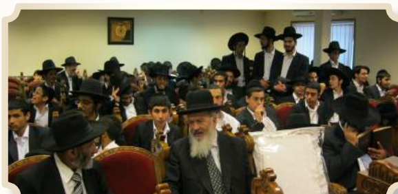
מצפים לבואו של מרן

בכדי ליצור אחדות בין הסניפים, "שבת אחים גם יחד". מיותר לציין כי בהנהלת הישיבות שמחו על ההצעה והתכוננו לקראת המעמד, מלבד ישיבת ברכת ה' - בנתיבות בראשות הגר"ד ישעיה שליט"א שנבצר מהם להשתתף מסיבות טכניות.