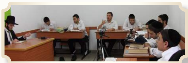
רווח נקי... לימוד רש"י בדיבוק חברים

המפרשים ופירושים הנושאים ונותנים בדברי רש"י, וכמובן בהשתתפות הבחורים היקרים, כל חד לפום חורפיה מקשה ומתרץ, ומציע את הפירוש הנאה לדעתו, עד שהדברים מתבררים ומתבהרים כסלת נקיה. ובנוסף