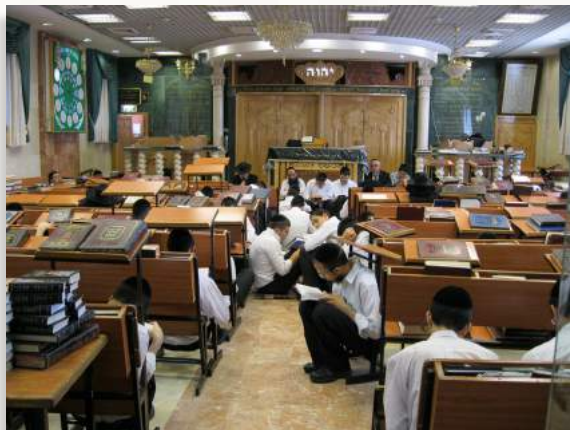
תלמידי ישי"ג באמירת תיקון חצות