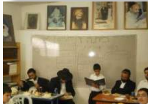
רויאל טיזאבי הי"ו – בני ברק