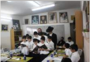
התלמידים המסיימים אומרים הדרן