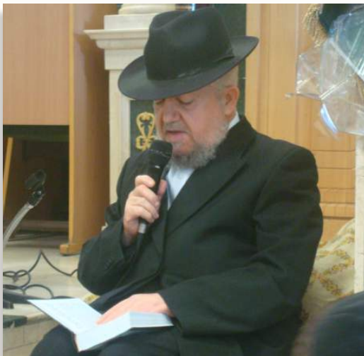
מרן ראש הישיבה בתיקון חצות

צדקה" עשיה, הוה ליה למימר: "עשו משפט וצדקה", כדכתיב בקרא אחר־נא: "עשות צדקה ומשפט" (משל כ"א, ג'). ועוד, דמפסוק זה נראה, דשניהם צריכין אל הגאולה, ואילו חז"ל למדו ממנו על הצדקה לחוד, שאמרו: "גדולה צדקה שמקרבת את הגאולה, שנאמר שמרו משפט ועשו צדקה". (בבא בתרא י' ע"א). אולם כבר כתב הרב חיי עולם דבזמן חורבן בית ראשון היה ביניהם צדקה כמבואר במדרש איכה (פרשה ה' פיסקא י"ד), והיה ראוי שתגן עליהם כמ"ש במדרש (פתיחה דרות רבה): "לעתיד לבוא כשבא הקב"ה, לכלה את האומות מן העולם, באים כל השרים של מעלה וכו', ואומרים: מה נשתנו אלו מאלו? הללו שופכי דמים וכו', הרי דמצות צדקה מגינה ומצלת מעונש שלש עבירות אלו, כמו שהשיב להם הקב"ה: "אני מדבר בצדקה וכו'" (ישעיה ס"ג, א'). ואם כן כל שכן הוא שלא יחרב? והשיב הוא, דכיון שבטלו המשפט, כמו שנאמר: "יתום לא ישפוטו" (ישעיה א', כ"ג), שוב לא תועיל סגולת הצדקה. ע"ש. ועל פי דבריו מיושב דעיקר אזהרת הפסוק על הצדקה שהיא מקרבת את הגאולה, אלא כדי שלא יעזבו ויבטלו את המשפט, ואז לא תועיל סגולת הצדקה וכמו