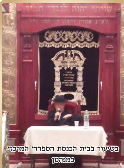
בשיעור בבית הכנסת הספרדי המרפזי בפמנהטן