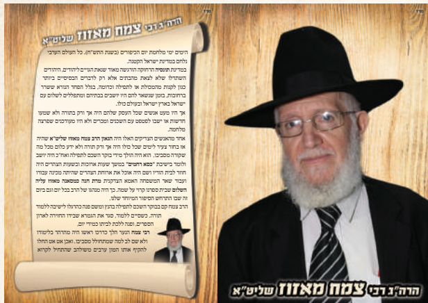
סיפור שמסרה אחת הבנות

הרמקולים של בית הספר שיר 'ספרדי' משירי שבת קודש, ובכל הכיתות מקבלות הבנות את מילות השיר, ולומדות יחד עם המורה את מנגינות השבת המסורתיות.