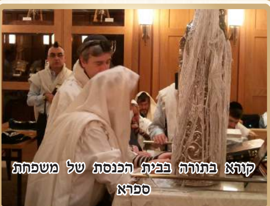
קורא בתורה בבית הכנסת של משפחת ספרא