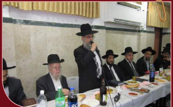
"המייסד" רה"כ הגר"ד עידאן נואם