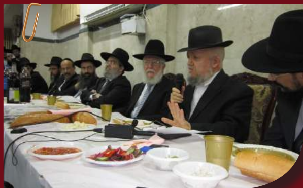
"לא להזניח את העיון"... מרן ראש הישיבה במשאור