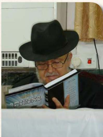
מון מעיין בספר החדש "באמונתך"