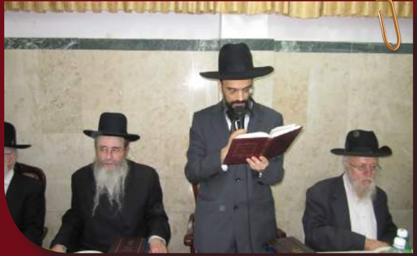
הרגע לו ציפו שבע שנים - הסיום