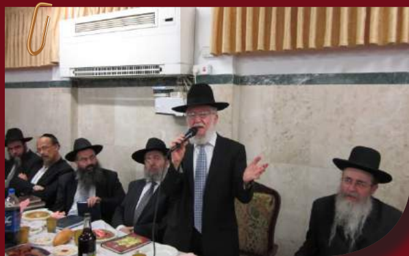
"תחליטו החלטה חזקה"... מוה"ר רבי צמח נואם

בהזדמנות זו בחר מוה"ר לעמוד על גזרת הגיוס, והקריא את דברי בעל הטורים שכותב בפרשת דברים "כי אילו יהא תלמיד חכם אחד בארבעים אלף איש לא צריכים לא רומח ולא חרב" "זאת אומרת" אמר הרב כי כל בן ישיבה שיושב ושוקד על התורה שקול כארבעים אלף!