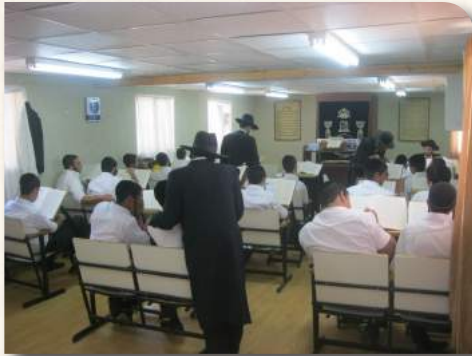
סדר בוקר בבית המדרש עם ראש הישיבה וצוות הרמ"ם

מחיבורו ביאורים וחידושים על ספר הנורא "משמרות כהונה"), מעודד מאד את הבחורים להשקיע את כחם ומרצם בעיון הגמרא וכתובי חידושים. וב"ה כבר זוכים לראות את ניצני הפירות המשובחים, וההתקדמות הגדולה שחלה בכלם, ברכותינו אליו שעוד יזכה רבות בשנים להרביץ תורה לעדרים בהצלחה רבה, ויראה ברכה בעמלו.