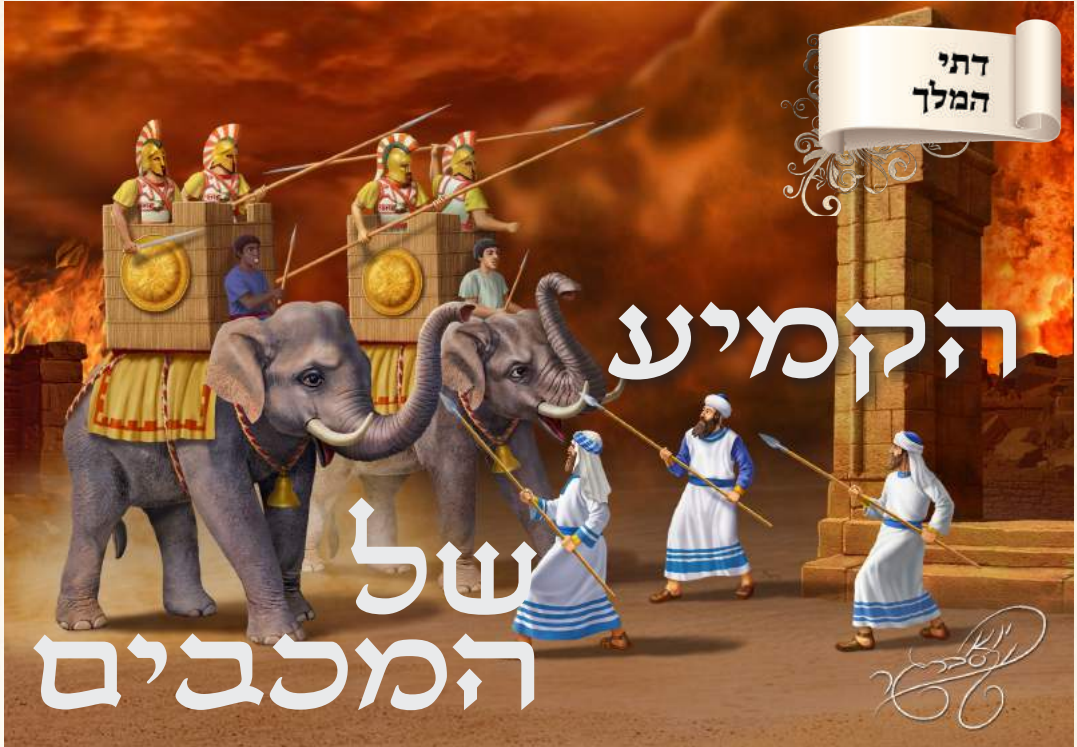
יצויר מתוך הספר "להודות ולהלל" באדיבות "מלכות וקסברגר"

יחד עם נצחונם של המכבים שהושיעו את ישראל, זכינו אף לקמיע של סגולה לשמירה מכל צרה ונזק. אמירת "זיהי נועם" שבעה פעמים לאור נרות החנוכה המרצדים, הינה סגולה מובטחת מענקי הרוח ומאורי האומה. במסגרת מאמר זה: המקור לסגולה, מה בדיוק צריך לומר וכמה? ואיזה אימונים ערכו החשמונאים לפני צאתם למלחמה?