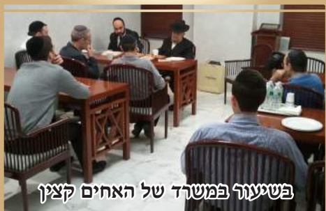
בשיעור במשרד של האחים קצין