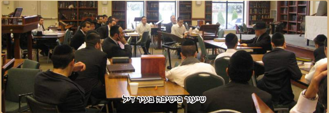
שיעור בישיבה בעיר דל