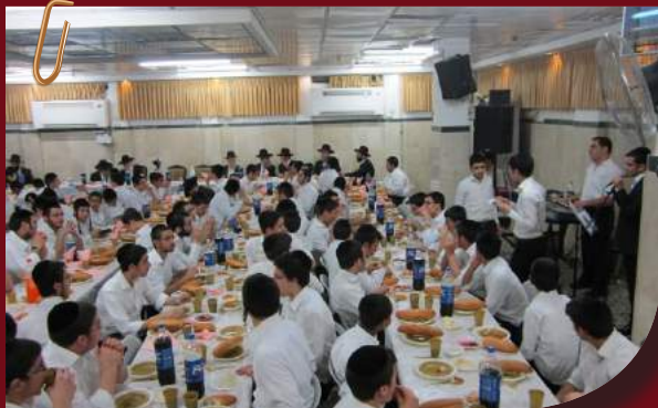
"שמחו שמחת תורה כי היא אורה..."