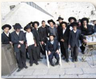
בכותל המערבי אשתקד