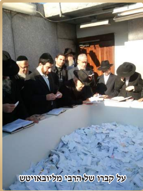
על קברו של הרבי מליובאוויטש