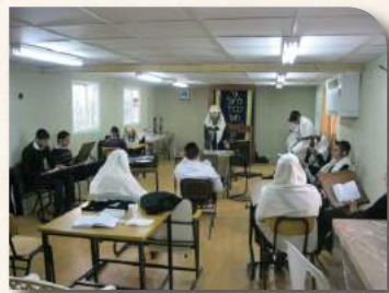
עענית הדיבור בישיבה בשבוע האחרון של השבב"ם