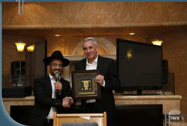
מעניק לראש העיר שי בחנוכת בית כנסת

לאחר שהרעיון החל להתגבש למשהו מעשי, הבנו כי אם אין גדיים אין תיישים וכי שומה עלינו איפוא להתחיל בפתחת תלמוד תורה