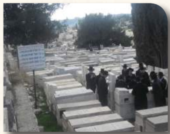
בחורי הישיבה בציון מרן מייסד הישיבה אשתקד