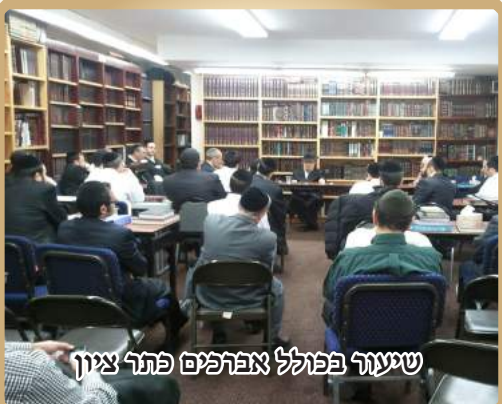
שיעור בפולל אברהם פתר ציון