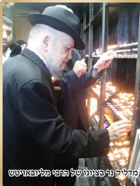
מדליק נר בציונו של הרבי מליובאוויטש