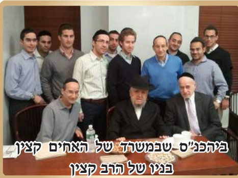
ביהפג"ס שבמשרד של האחים קצין בניו של הרב קצין