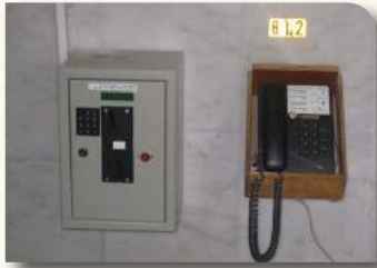
מערכת לטעינת שיחות

בשלהי זמן קיץ, הוחלט בהנהלת הישיבה על שדרוג המערכת הטלפונית המיועדת לבחורי הישיבה. בין השיקולים שהביאו להחלטה למרות ההוצאות הכספיות הכרוכות בזה, היתה העובדה כי הוראת רבני הישיבה היא כידוע שאין לבחורי ישיבה להחזיק מכשיר פלאפון ואף לא מאושר, הוראה שניתנה בישיבה מיום צאתו של הפלאפון לאור עולם, ולימים התבררה כגורלית וחשובה ובעשור האחרון הרבה ישיבות חשובות אימצו הנהגה זאת, ועל כן יש לתת לבחורים תחליף למכשיר הפלאפון ע"י מערכת טלפונים מספקת שתעמוד לשירות הבחורים.