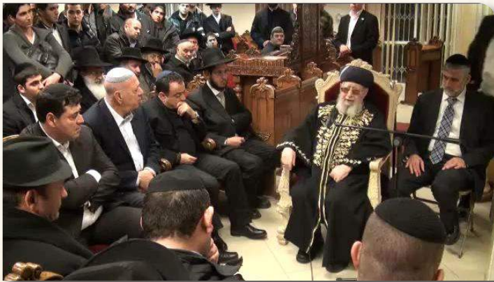
מחן הראש"ל מנחם את המשפחה הנכבדה

במקביל התקבלו הבנים ובני המשפחה במעונו של מחן הראש"ל הגר"ע יוסף שליט"א , שהשתתף בצערם ונשא דברי הספד וחיזוק לכבוד המנוחה ז"ל.