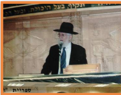
מוה"ר רבי צמח מאזוז שליט"א מספיד את המנוח בהיכל הישיבה

הכל החל כעשר שנים לפני כן. ר' יוסף, נועץ עם מרן הגר"מ מאזוז שליט"א ואחיו הגאון רבי צמח מאזוז שליט"א, מיה לעשות על מנת להסיר את הקללה הרודפת אחרי המשפחה. הפתרון שהציעו הרבנים היה כי הטובה הגדולה ביותר שיכולה להיות לנשמתו של הצדיק - היא להעלות את עצמותיו הקדושות לארץ, שכן ידועים היו כיסופיו