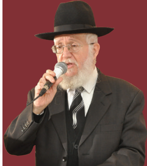
הגלויים שאנחנו רואים בישיבה.