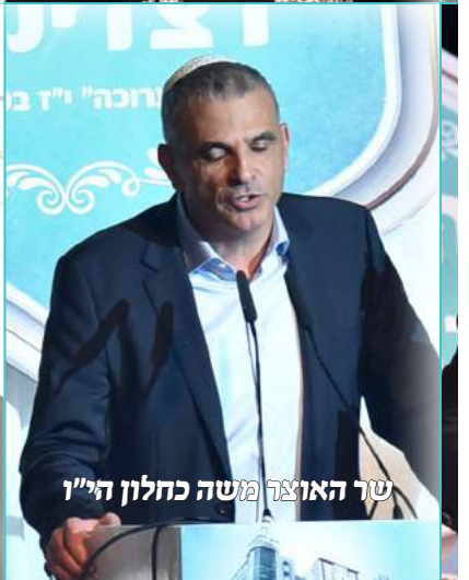
שר האוצר משה כחלון הי"ו