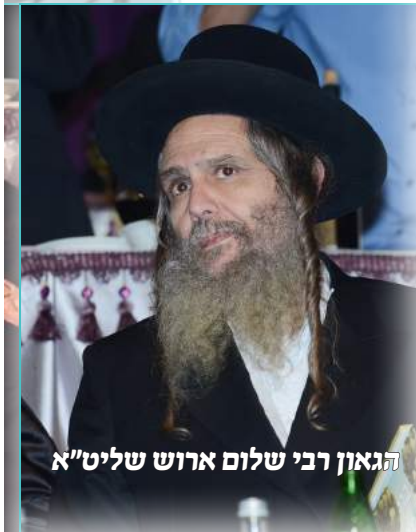
הגאון רבי שלום ארוש שליט"א