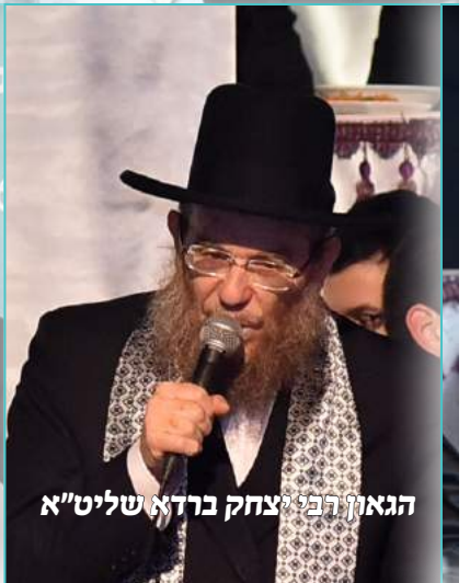
הגאון רבי יצחק ברדא שליט"א