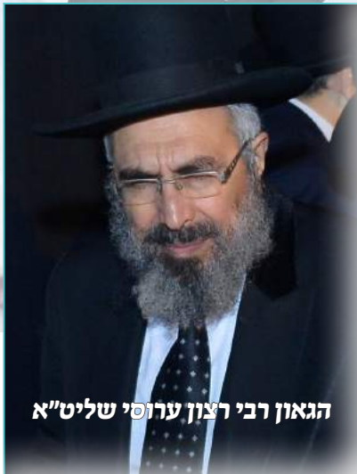
הגאון רבי רצון ערוסי שליט"א