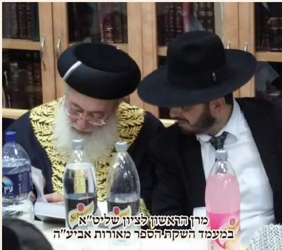
מרן הרה"ג שון לציון שליט"א במעמד השקת הספר מאורות אביע"ה

קובעים ברכה לעצמם כללי המקרא שלראשונה התקבצו לפונדק אחד, והוא דבר חדש שלא היה כמותו מעולם "ולא ראיתי עד כה שום ספר שקיבץ את הכללים הרבים שהציבו מפרשי המקרא