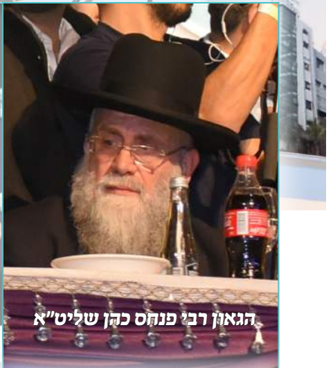
הגאון רבי פנחס כהן שליט"א