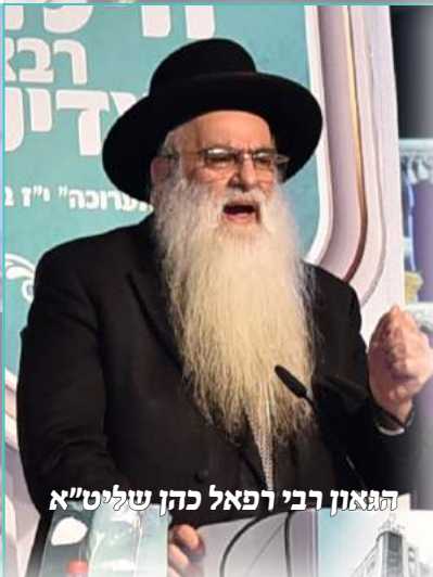
הגאון רבי רפאל כהן שליט"א