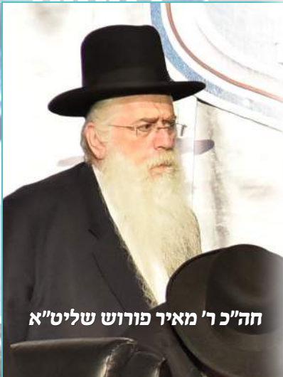
חה"כ ר' מאיר פורוש שליט"א