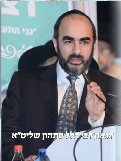
הגאון רבי הלל סתהון שליט"א