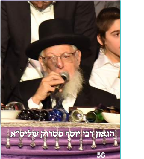
הגאון רבי יוסף סטרוק שליט"א